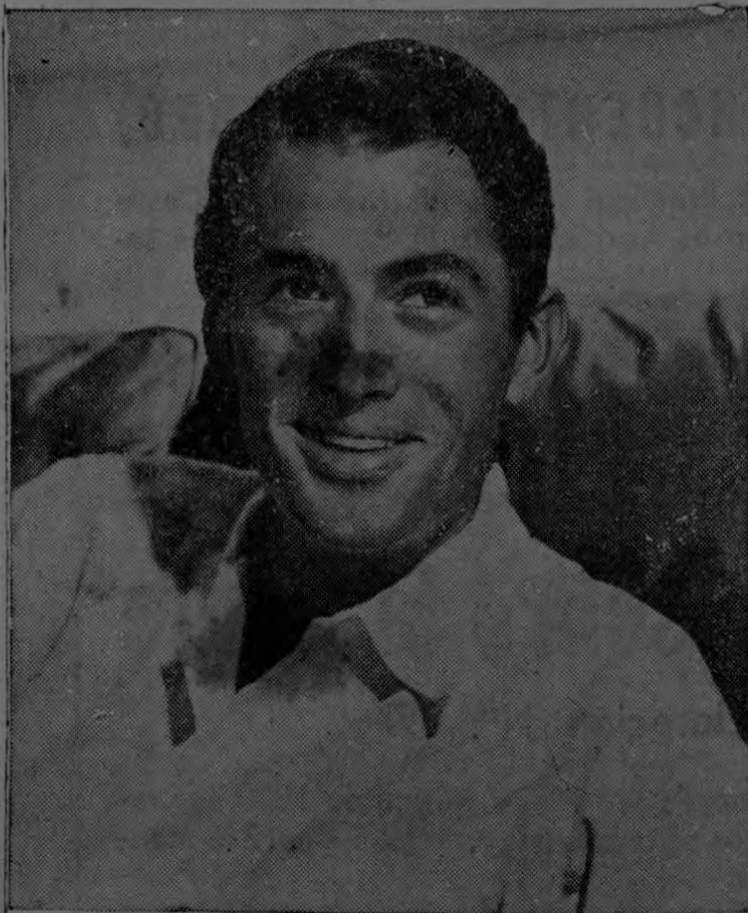
GREGORY PECK. . . ASTRO DE LA METRO GOLDWYN MAYER

El contrato cinematográfico de Gregory Peck es uno de los más extraordinarios en la historia de Hollywood; contiene una cláusula que le permite trabajar para cinco compañías productoras de peli-