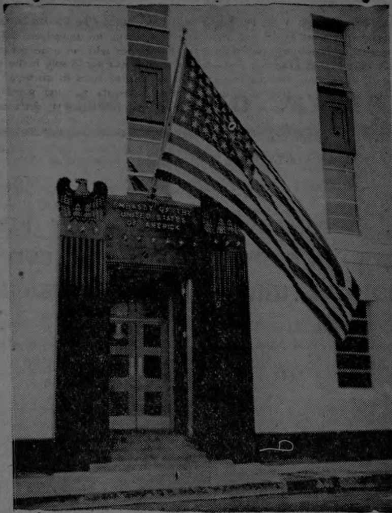
Entrada principal del nuevo edificio de la Embajada Americana.