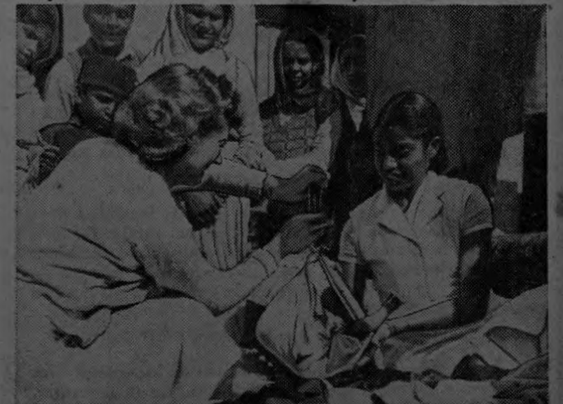
Representantes de la Escuela de Enfermeras de Nueva Delhi enseñan a un grupo de madres en la India el mejor cuidado de sus hijos. Las enfermeras visitan periódicamente los hogares de acuerdo con un programa de la Organización Mundial de la Salud.